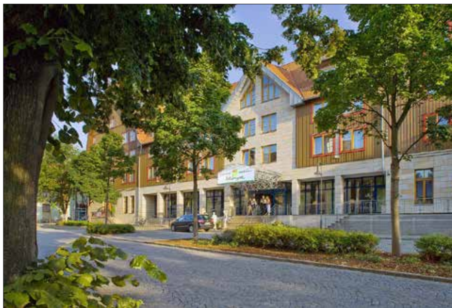
HKK Hotel Wernigerode.

Das zweite Thema widmet sich insbesondere unseren Prioritäten innerhalb der Entwicklungen, die in den kommenden Jahrzehnten für unseren historischen Eisenbahnsektor zu erwarten sind. Wir organisieren eine Podiumsdiskussion mit herausragenden Experten, die ihre Sicht über die Zukunft kurz vorstellen werden. Diese Ansichten werden die Grundlage für Diskussionen mit ihren Kollegen auf dem Podium sowie mit Ihnen allen als Delegierten im Konferenzsaal bilden.