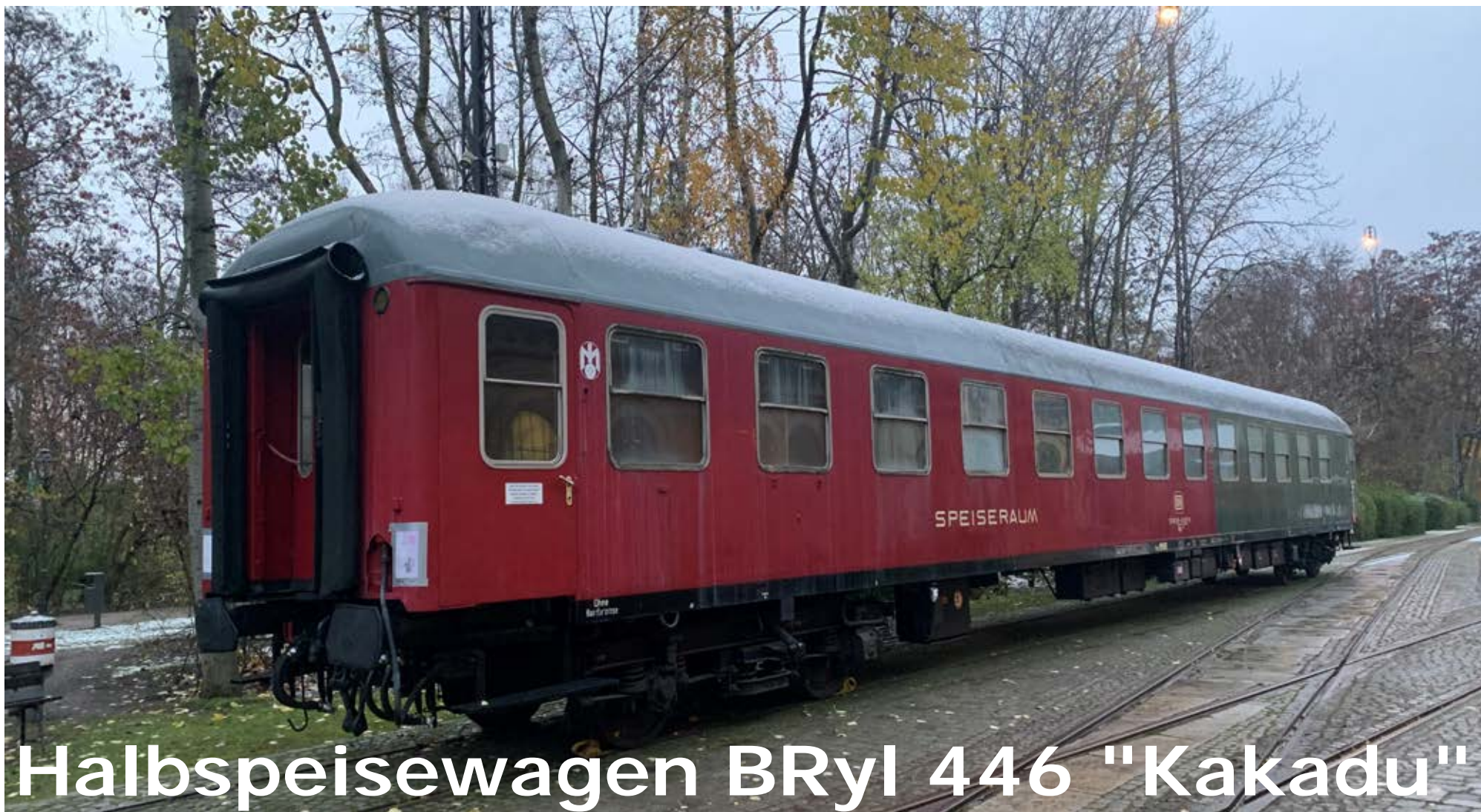
Halbspeisewagen BRyl 446 "Kakadu"