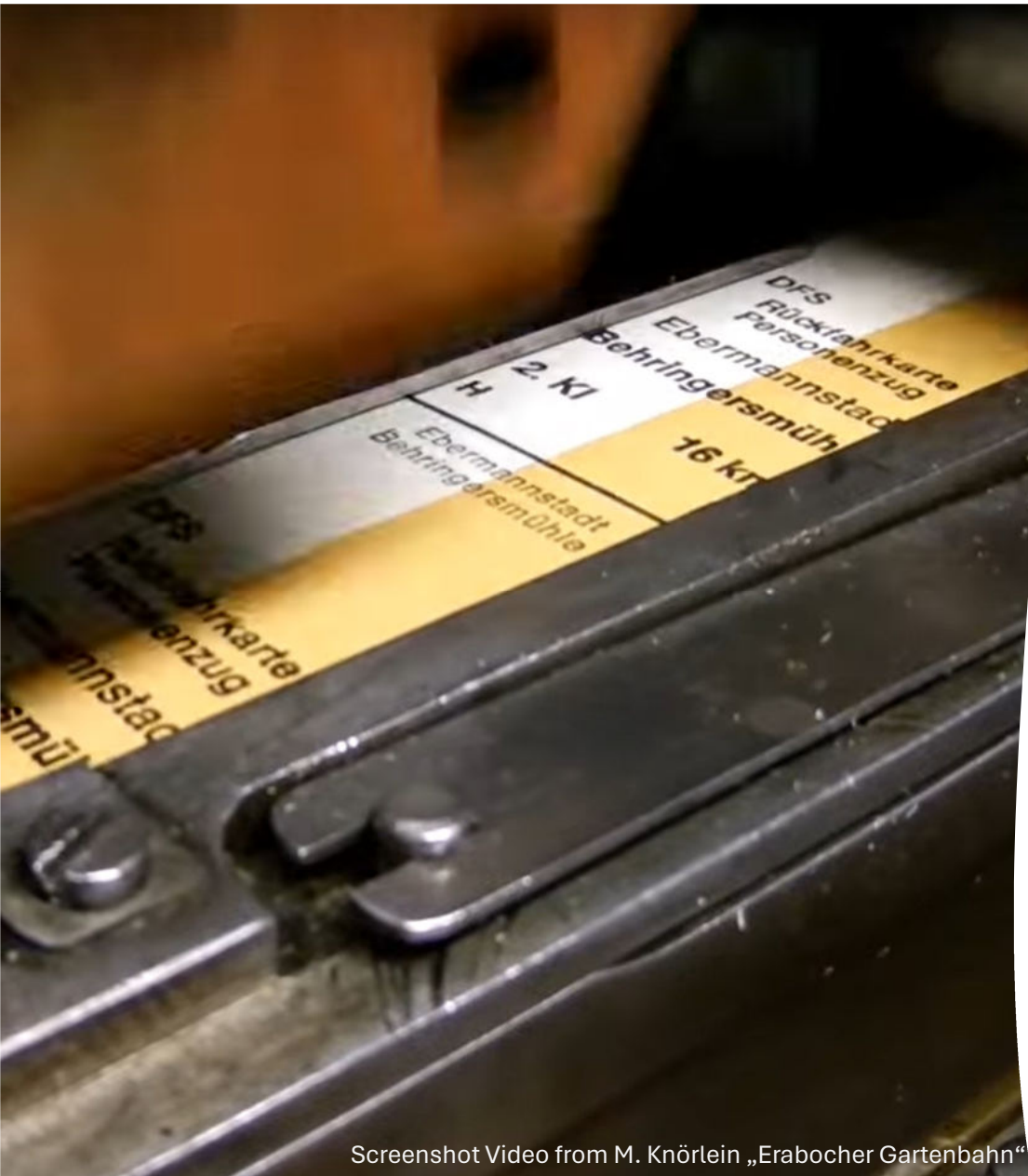
Screenshot Video from M. Knörlein „Erabocher Gartenbahn“