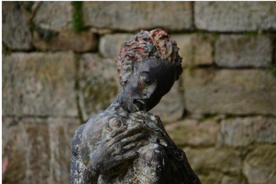
Hans Scheib – Mädchen/Tod 1992