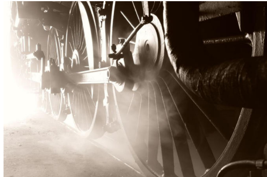
BW Arnstadt 2018